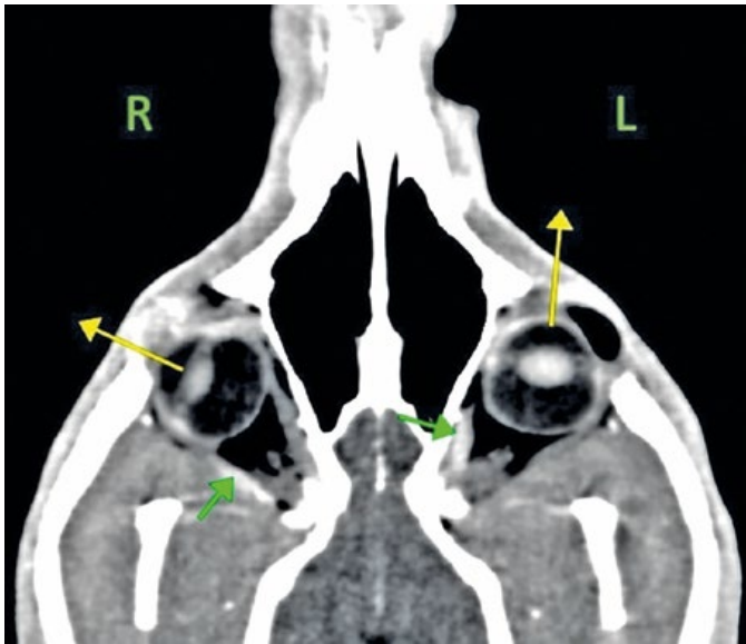
Рис. 1. Пример асимметрии перфузии прямых мышц глаза в зависимости от разворота глазного яблока. Желтые стрелки отмечают направления глазных яблок, зеленые стрелки — прямые мышцы глаза с более выраженной перфузией An example of the asymmetry of the color of the rectus muscles of the eye depending on the rotation of the eyeball. Yellow arrows mark the directions of the eyeballs, green arrows mark the rectus muscles of the eye with hyperperfusion