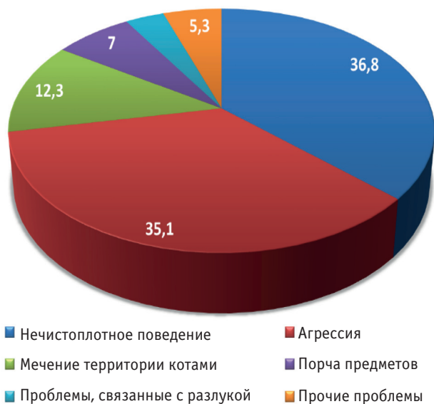
Рис. 1. Проявления девиантного поведения у кошек, % (по данным специалистов по поведению животных) [8]

Основными проявлениями как агрессивного, так и тревожного типов девиантного поведения у кошек являются нечистоплотность в доме, агрессия по отношению к людям и к другим животным и мечение территории самцами (рис. 1). Установлено, что порода, возраст, пол и среда обитания кошки также могут влиять на возникновение конкретных проблем. Чаще других нежелательное поведение присуще персидским, сиамским, бирманским и им подобным породам. Персидские кошки отличаются большей склонностью к нечистоплотному поведению, порче мебели и вещей, хотя обладают спокойным, неагрессивным характером. Престарелые кошки обычно толерантны к незнакомым людям, но при этом менее терпимы к другим животным. Самцы чаще, чем самки, проявляют чрезмерную вокализацию, метят территорию мочой, но при этом редко проявляют агрессию по отношению к знакомым животным [8, 20, 38].