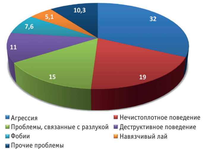
Рис. 2. Проявления девиантного поведения у собак, % (по данным специалистов по поведению животных) [8]

У собак наиболее распространенными проявлениями нежелательного поведения бывают агрессия, нечистоплотное поведение в доме и проблемы, вызванные разлукой (без уточнений) (рис. 2) [8].