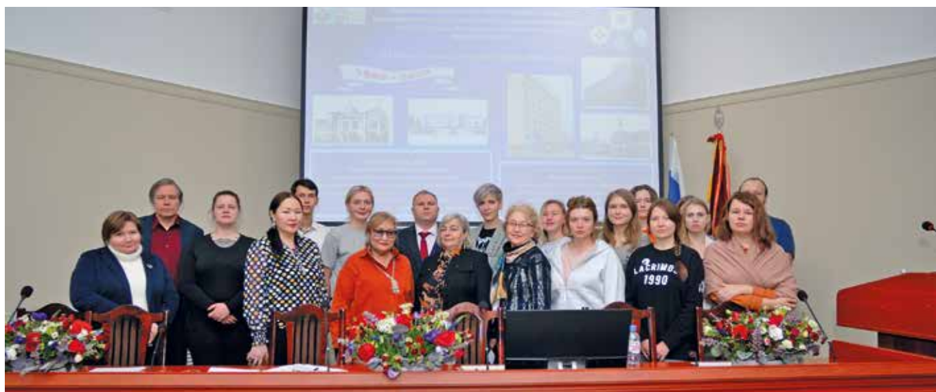
Фото 2. Организаторы и участники Научно-практической конференции «Актуальные вопросы ветеринарной медицины диких животных и сохранения биоразнообразия»