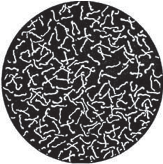
Рис. 1. Лептоспиры в тёмном поле микроскопа Fig. 1. Leptospira under dark-field microscope

кация лептоспир, согласно которой, существуют 9 геномных видов патогенных лептоспир [31], объединяющих более 300 сероваров, входящих в 25 серологических групп. Серовар является основной таксономической единицей, серогруппа — понятие условное, но в практической работе его используют во всем мире.