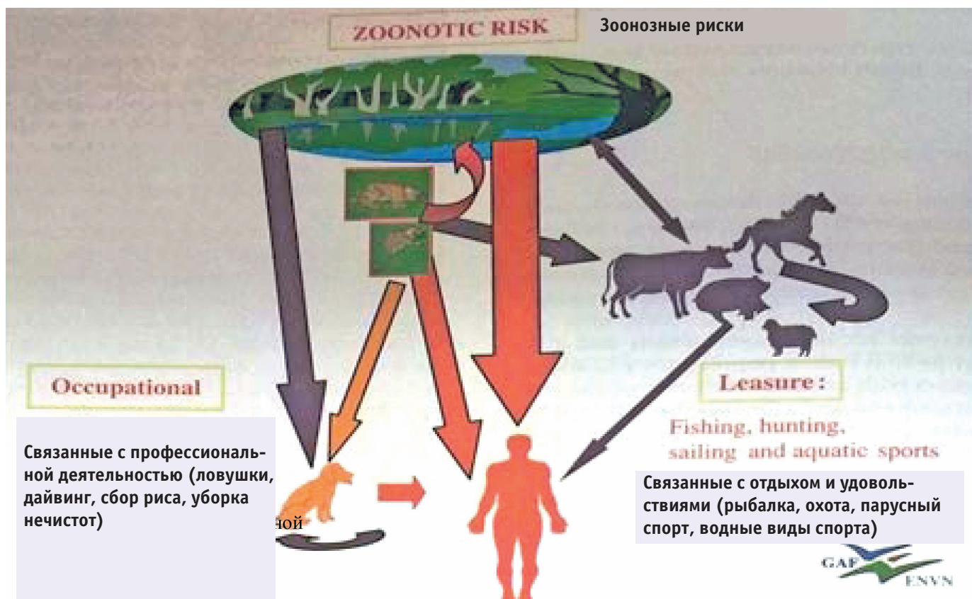
Рис. 4. Схема инфицирования человека и животных: зоонозные риски связаны с профессиональной деятельностью и отдыхом Fig. 4. Infection process of human and animals: zoonotic risk connected with occupational and leisure